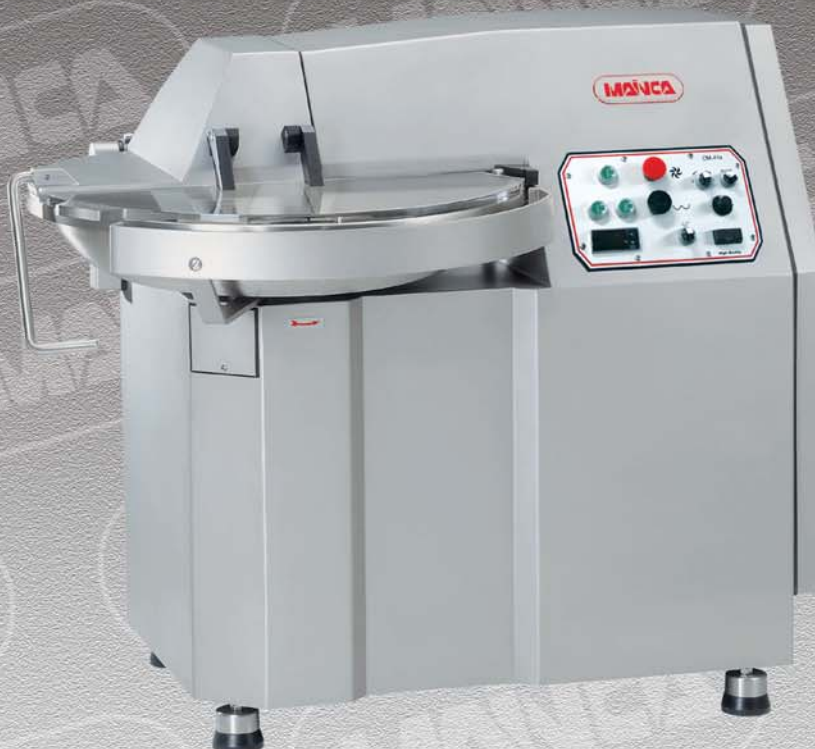
CM-41 / CM-41S