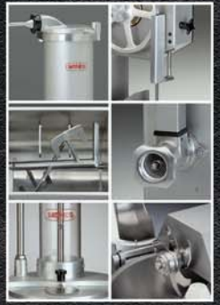
PM-114L PM-98L / PM-32L