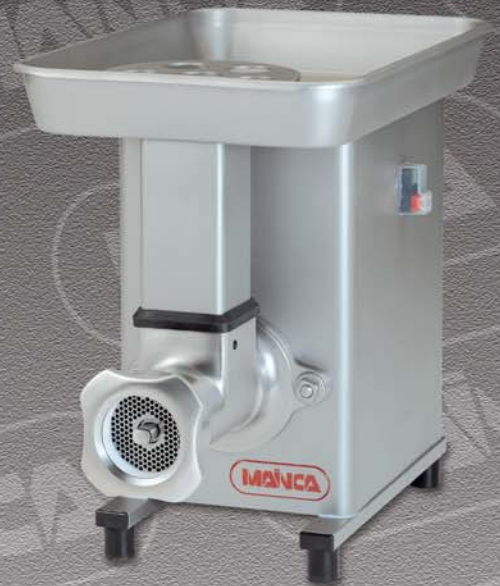
PM-114 PM-98 / PM-32