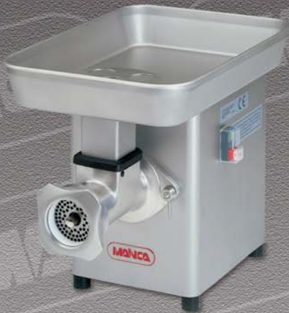
PA-82 / PA-22 PM-82 / PM-22