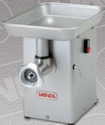
PM-70 / PM-12